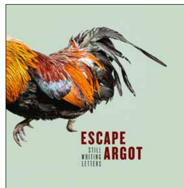
Escape Argot Still Writing Letters Label: Traumton Format: CD